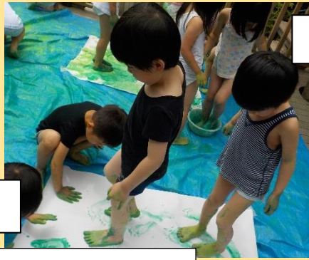
半紙染め、開いたらどうなるかな？