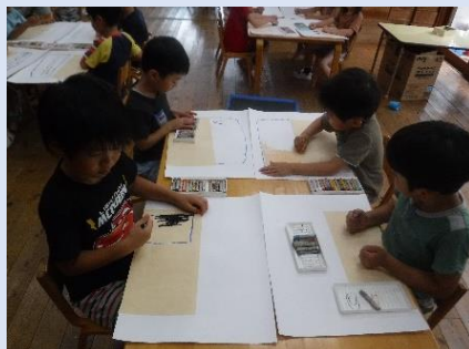
おみせやさんの絵