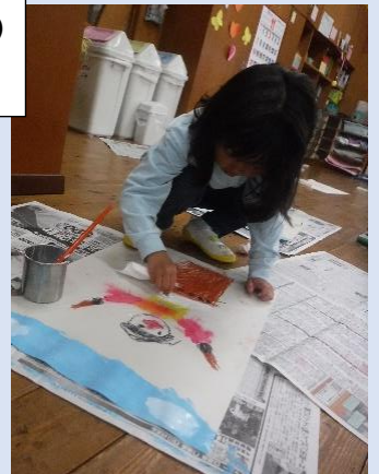
なかよしまつりの絵