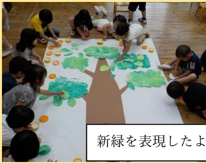
新緑を表現したよ