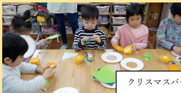
クリスマスパーティーを楽しみに飾り付け作り！